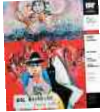
GEÇ KALANLAR 7-24 Ekim Altındağ T. ve Şinasi S