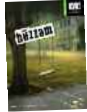
HÜZZAM 12-30 Ekim Oda Tiyatrosu