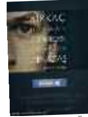
SOSYAL AĞ Yön: David Fincher 22 Ekim itibarıyla