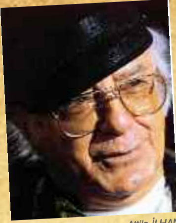
Attila İLHAN (1925-11.10.2005)