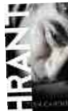
Hrant Tuba Çandar Everest Yayınları