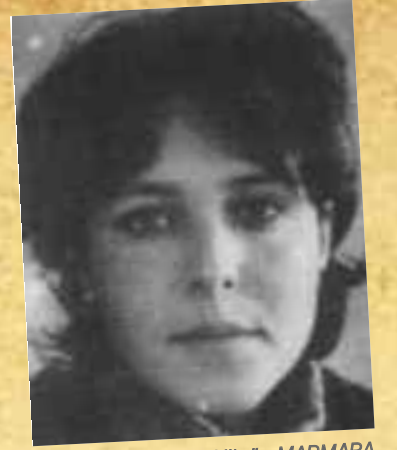
Nilgün MARMARA (1958-13.10.1987)