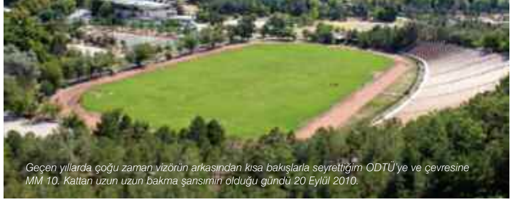
Geçen yıllarda çoğu zaman vizörün arkasından kısa bakışlarla seyrettiğim ODTÜ'ye ve çevresine MM 10. Kattan uzun uzun bakma şansımın olduğu gündü 20 Eylül 2010.

Kuzey yönüne doğru bakınca önce yerlerde allenin taşları pek ufak tefek görünüyor. Allenin taşlarının en güzel görüldüğü yer burası. Yaş-