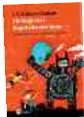
Bildirdiğimiz Kap. Sonu .K. Gibson-Graham Metis Kitap