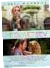
YE DUA ET SEV Yön: Ryan Murphy 8 Ekim itibarıyla