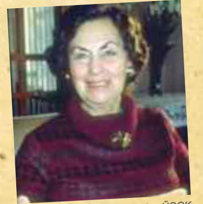
Bahriye ÜÇOK (1919-06.10.1990)