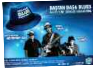
BLUES FESTİVAL Bilkent Otel 21-22-23 Ekim/ 18:30