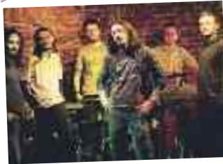
MARSİS Telwe Performance Hall 16 Ekim/ 20.00