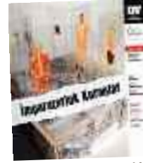
İMPARATORLUK KURANLAR 12-17 Ekim Akün Sahnesi