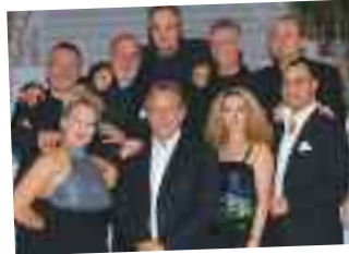
İSTANBUL GELİŞİM ORKESTRASI ODTÜ KKM Kemal Kurdaş Salonu 18 Ekim/ 20.00