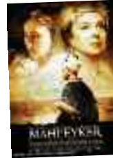
MAHPEYKER Yön: Tarkan Özel 15 Ekim itibarıyla