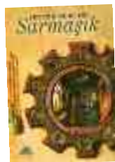
Sarmaşık Şebnem İşigüzel İletişim Yayınları