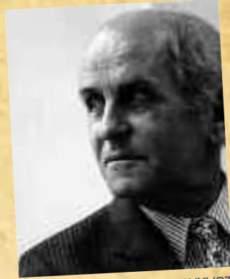
Fakir BAYKURT (1929-11.10.1999)