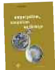
Emperyalizm Korkut Boratav Yordam Kitap