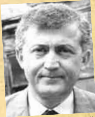
Ahmet Taner KİŞLALI (1939- 21.10.1999)