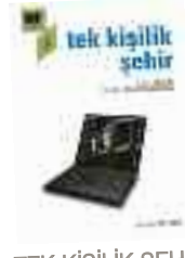
TEK KİŞİLİK ŞEHİR 12-17 Ekim Şinasi Sahnesi