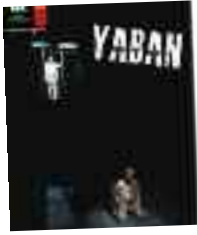
YABAN 7-30 Ekim İrfan Şahinbaş T.