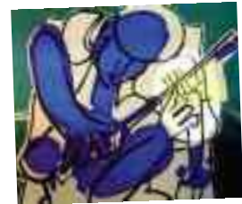
Adnan Turani 16 Ekim- 4 Kasım Arete Sanat Galerisi