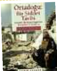
Ortadoğu: Bir Şiddet Tarihi Hamit Bozarslan İletişim Yayınları