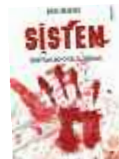
Sistem Karl Olsberg Can Yayınları